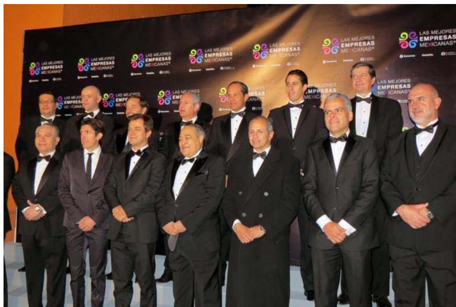
En la quinta edición de MEM, 19 empresas recibieron el reconocimiento por primera vez.

Archivado en: Industrias | Empresas Mexicanas | Impreso | Sector Industrial | Empresas